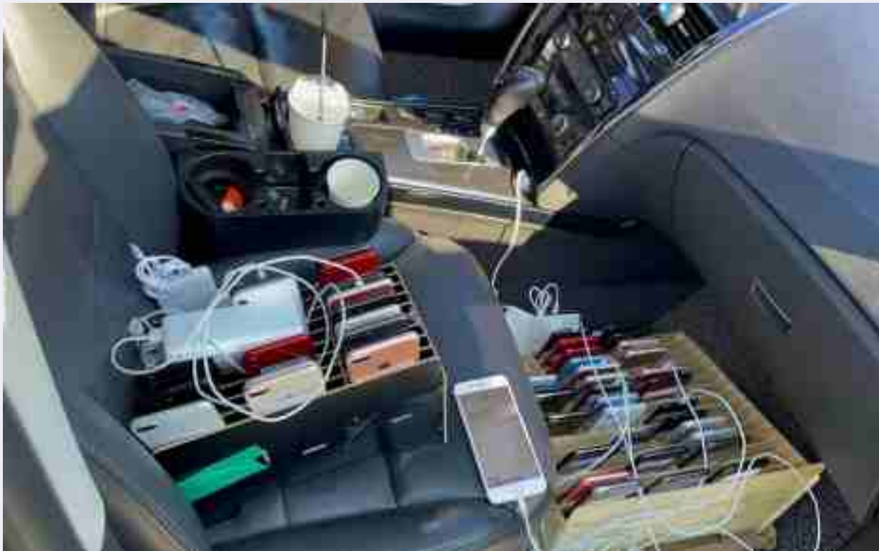
Phương thức ghép nối VPN

Giúp người khác truy cập VPN hoặc sử dụng bộ trung kế VoIP cũng là phạm pháp