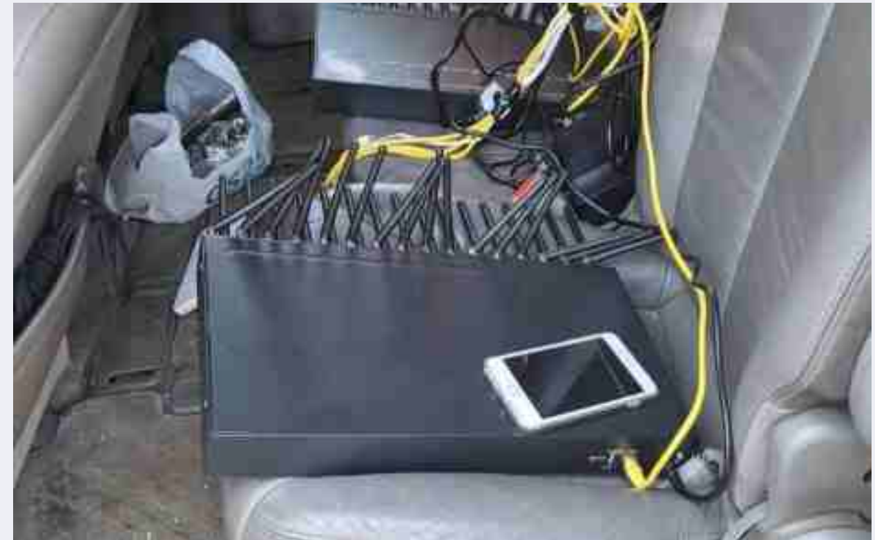
Phương thức bộ trung kế VoIP