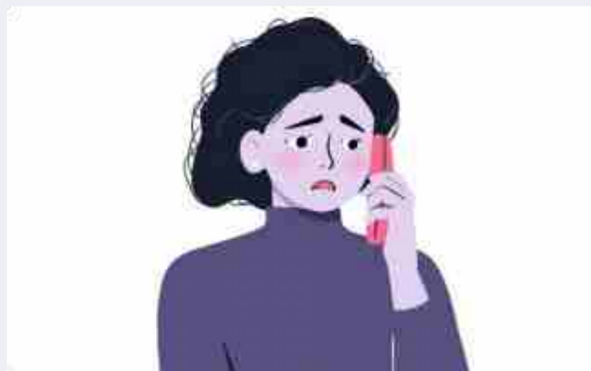
Yêu cầu tư vấn pháp lý