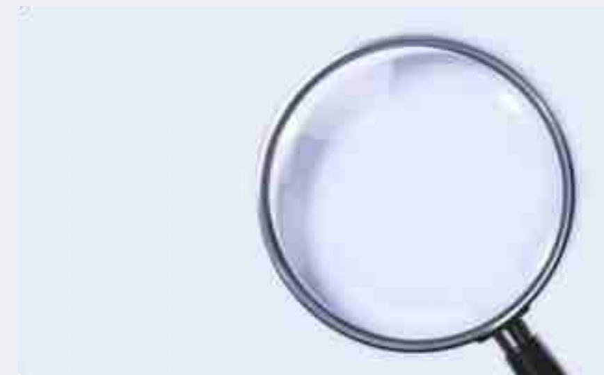
Luôn luôn chú ý